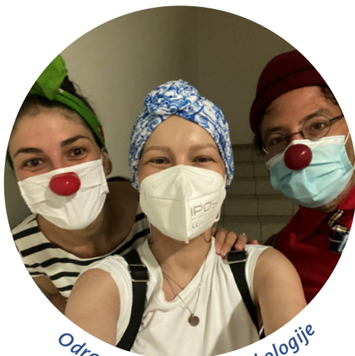
Odraslima na odjelu onkologije