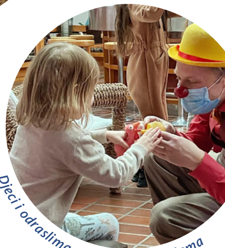
Djeci i odraslima u kriznim situacijama

Kome sve klaunovi donose trenutke radosti, olakšanja i optimizma?