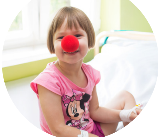
Djeci u bolnicama