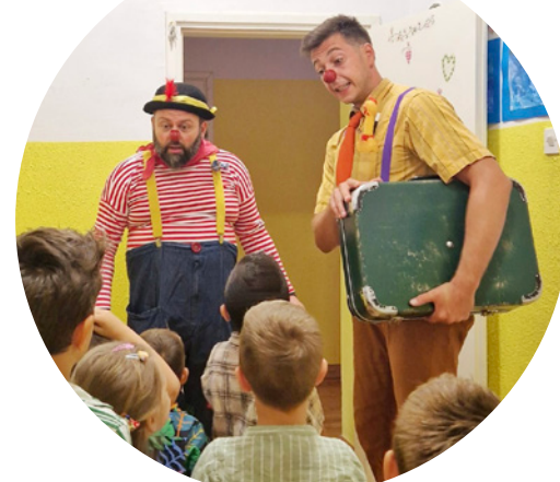
Djeci u domovima