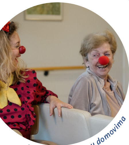
Starijim osobama u domovima