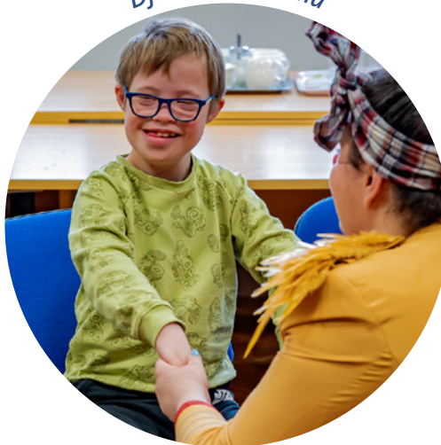
Djeci s teškoćama